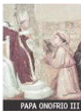
PAPA ONOFRIO III

1217. Il 5 maggio, Pentecoste, si svolge il primo capitolo generale del nuovo Ordine alla Porziuncola; vengono erette 12 circoscrizioni e inviate missioni oltralpe e oltremare.