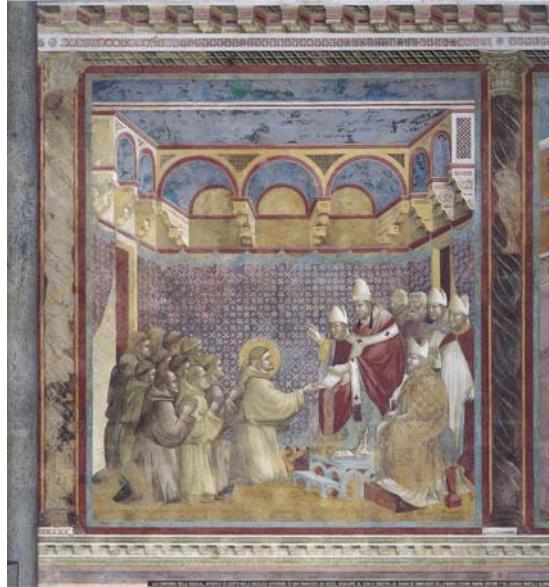
«LA CONFERMA DELLA REGOLA», AFFRESCO DI GIOTTO NELLA BASILICA SUPERIORE DI SAN FRANCESCO AD ASSISI, RISALENTE AL 1296. A SINISTRA «IL SOGNO DI INNOCENZO III»

LA REGOLA FRANCESCANA COMPIE 8 SECOLI. SECONDO UN'ANTICA TRADIZIONE ERA IL 16 APRILE 1209 (PERÒ LA DATA È CONTROVERSA) QUANDO FRANCESCO E I SUOI CONFRATELLI SI VIDERO APPROVARE LA 'FORMULA VITAE' CON LA QUALE SI IMPEGNAVANO A VIVERE IN POVERTÀ, OBBEDIENZA E CASTITÀ, SECONDO LA DOTTRINA E L'ESEMPIO DI GESÙ CRISTO